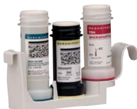
Штатив ARCHITECT i1000SR

Ваши преимущества: сопоставимые результаты пациентов на всех иммунохимических анализаторах ARCHITECT, надежность и легкость в использовании.